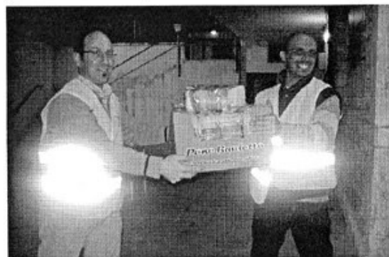
Gran lavoro in casa Overland

aiuto successivo, sottolinea che, come scritto su Avvenire di mercoledì, la Chiesa ha già stanziato 3 milioni di euro e sottolinea, con l'intento di arginare l'abominevole pratica